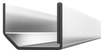
229 026 Espesor: 2,0mm