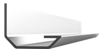
229 026 Espesor: 1,5 | 2,0mm