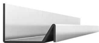
259 025 Espesor: 1,5mm