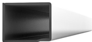
455 235 Thickness (mm): ?mm