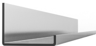
D152 Blechdicke: 1,5mm