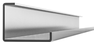
D154 Blechdicke: 2,0mm