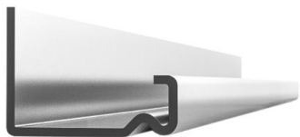
229 026 Blechdicke (mm): 1,5 | 2,0mm